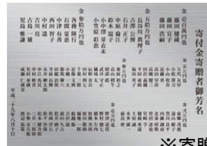
※寄贈銘板イメージ