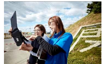
ARタブレットツアー

全国高校総合文化祭プレ大会新聞部門被災地取材 宮城県九州地域中学校長教育旅行視察 など 約30件