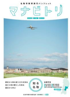
教育旅行パンフレット

東北・北海道地域旅行会社 約60社に4000部 掲載店舗、札幌・函館中学校等 30か所2000部