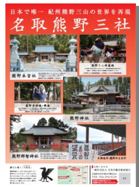
熊野三社ポスター

熊野三社、名取の老女伝説、ご朱印、お守り、眺望など熊野三社にまつわる情報を盛り込んだ、特集ページを制作し、1月から公開した。