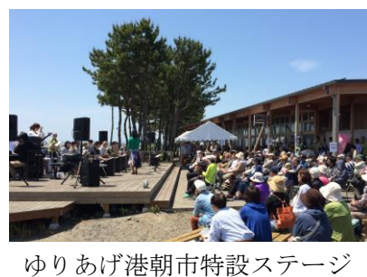
ゆりあげ港朝市特設ステージ