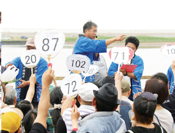
活気ある名物の競り市